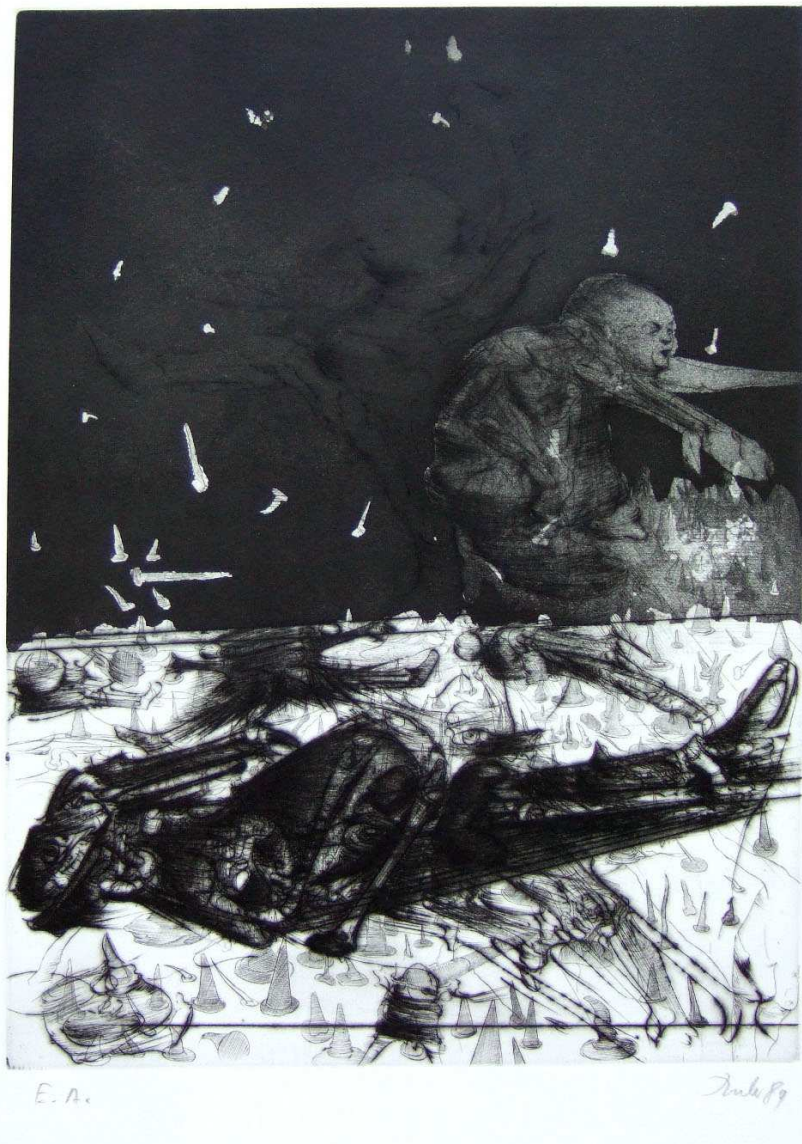
Dado, Barbey d'Aureville , « Le Bonheur dans le crime », 1989. Aquatinte et pointe sèche, 38 x 56 cm