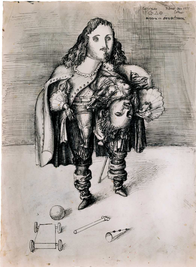
Dado, Colloredo , 1955. Encre et lavis d'encre sur papier, 47 x 35 cm. Ancienne collection Jernej Vilfan, collection particulière.