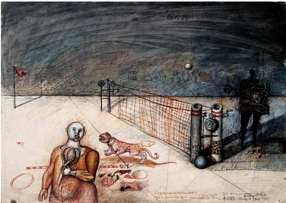
Dado, Sans titre (cours de tennis à Cetinje) , 1955. Encre et lavis sur papier, 29 x 42 cm, Collection de Diotime, petite-fille de Dado.